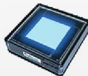
RGB 7 ЦВЕТ ИЗМЕНЕНИЙ